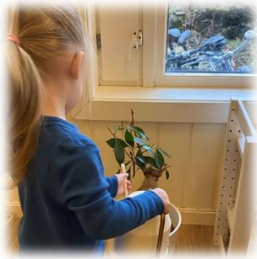
Ta vare på miljøet

montessoribarnehagen solsikken montesol.no